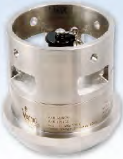
511 HAMMER UNION接头 MWD, 泥浆泵压力