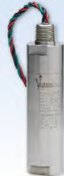
570 危险区域 大钩负荷压力