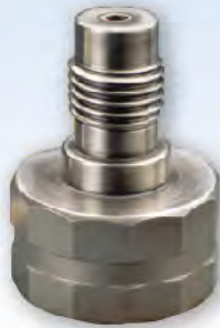
PT332 高温 井下钻孔工具